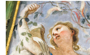
Iglesia parroquial de San Pedro Ad Víncula