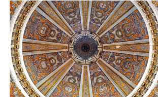
Iglesia del Convento de Benedictinas de San Plácido