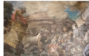
Basílica Pontificia de San Miguel