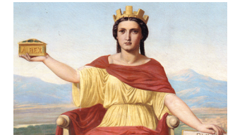
Congreso de los Diputados