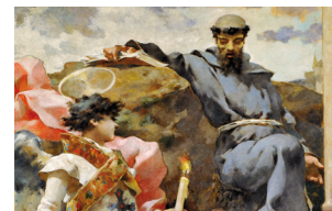
Real Basílica de San Francisco el Grande