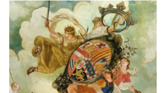
Casa de la Panadería