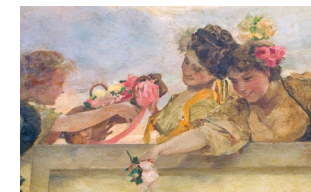
Casino de Madrid