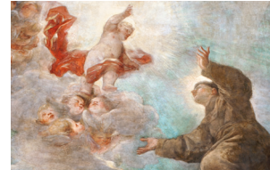
Iglesia de San Antonio de los Alemanes